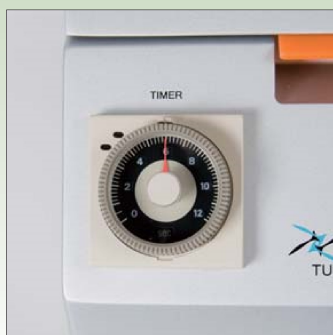
タイマー設定ダイヤル