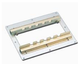
材料ガイド : G15S