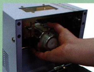
ワンタッチで着脱可能