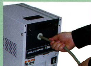
作業方法(フットスイッチ使用)