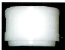
サイズご指定のブッシュ1個 (ブッシュは、φ6.0~30.0まで、0.2mm単位でご用意しております)